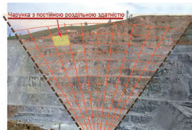
Радар із синтезованою апертурою