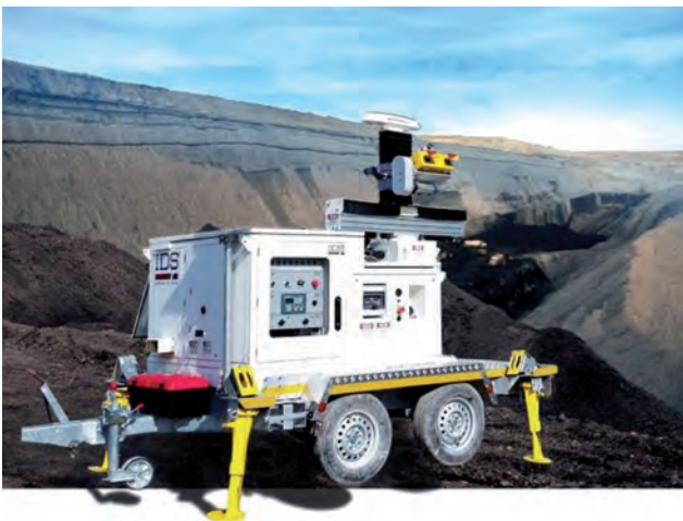
Рис. 4. Радарна система IBIS-ROVER