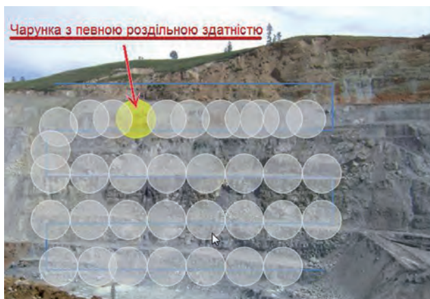
Радар з реальною апертурою

Переваги IPCA-технологій порівняно з попереднім поколінням (радарів з реальною апертурою) очевидні: це і підвищення роздільної здатності отриманого зображення, збільшення робочої відстані від схилу, зменшення часу знімання, зменшення кількості механічних рухомих частин у приладі, знижене енергоспоживання. Покращення цих показників дає змогу користувачам повністю охопити всі потенційно нестабільні ділянки і по загальному схилу, і між кількома його сегментами.