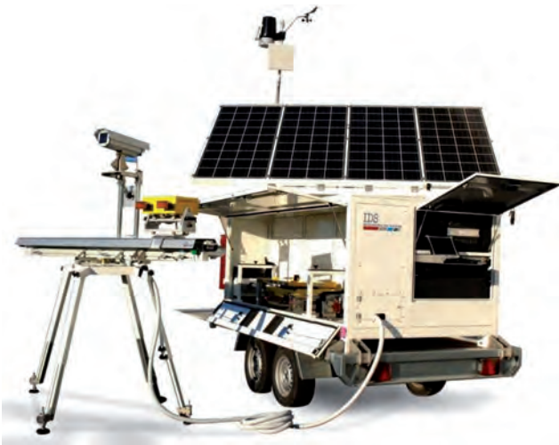
Рис. 3. Радарна система IBIS-FMT