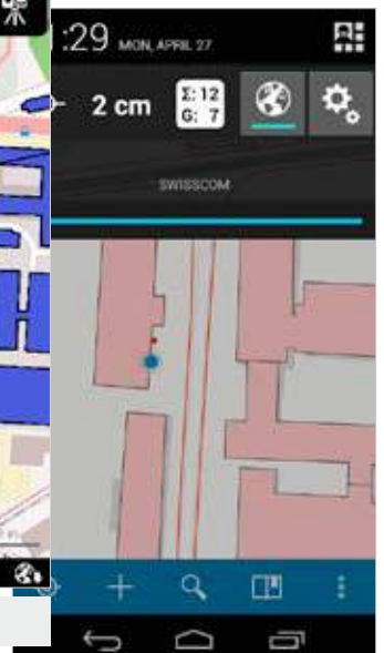
Zeno Connect (версия Android)