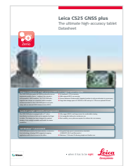
Leica CS25 GNSS Технические характеристики