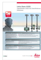
Leica Zeno GG03 Технические характеристики