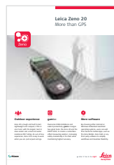
Leica Zeno 20 Технические характеристики

Иллюстрации, описания и технические характеристики не являются обязывающими. Все права защищены. Copyright Leica Geosystems AG, Heerbrugg, Switzerland, 2015. 835750ru - 05.15 - INT