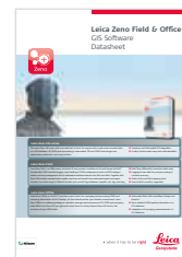
Leica Zeno Программное обеспечение Технические характеристики